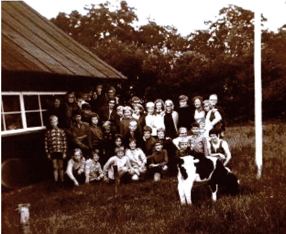
G.J.V. LEDEN OP KAMP